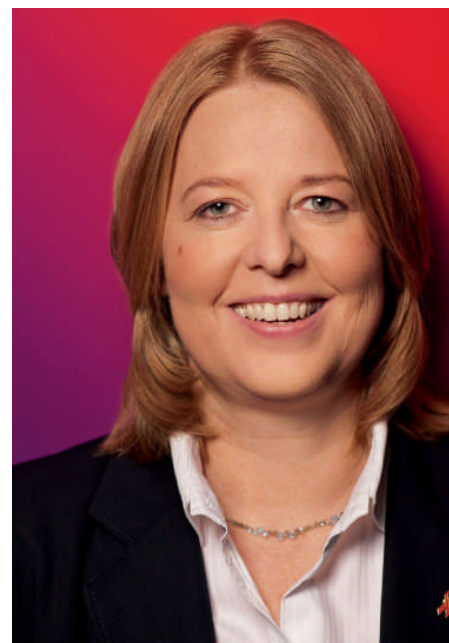
Bis zum nächsten Mal, ich freue mich drauf, Bärbel Bas

Post aus meinem Wahlkreis wird selbstverständlich immer beantwortet - auch wenn's manchmal schwer fällt. Ein promovierter Petent forderte jetzt von mir: „Bitte stoppen Sie den Wahnsinn!! Lassen Sie keine Flüchtlinge mehr ins Land und schicken Sie alle zurück, die schon gekommen sind“. Auszug aus meiner Antwort: „Ich sehe nur in den Herkunftsländern der Flüchtlinge einen „Wahnsinn“, den wir stoppen müssen. Und zwar den Wahnsinn von Krieg, Verfolgung und Zerstörung, der auch mich mit meiner Familie auf den Weg in Richtung Sicherheit treiben würde. Wir werden diesen Menschen (...) auch weiterhin Schutz bieten und sie keinesfalls zurück ins Verderben schicken.“